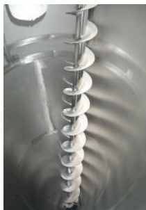
Blick in den Mischer