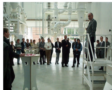
Einweihung der neuen Produktionshalle