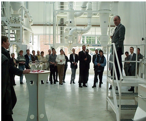
Einweihung der neuen Produktionshalle