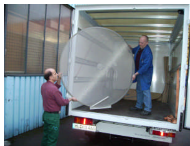
Abhol- und Lieferservice