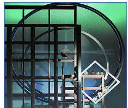
Siebrahmen und -ronden