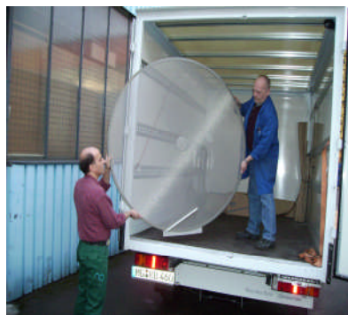
Service de transport